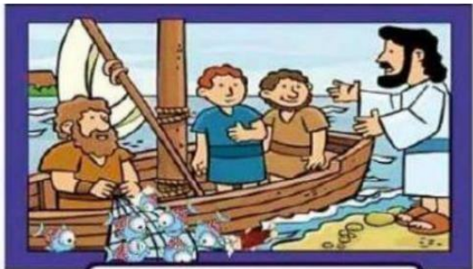
Lucas 5, 1- 4