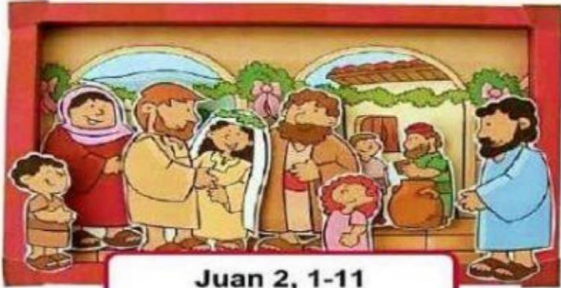
Juan 2, 1-11

7. Con ayuda de un familiar busca en la biblia y descubre el nombre del milagro que realizo Jesus.